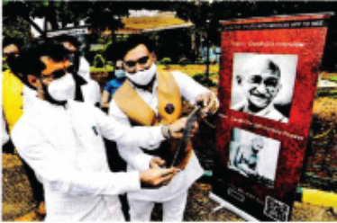
Tourism, Kannada & Culture Minister CT Ravi scans the code for an interactive experience on the life of Mahatma Gandhi in Bengaluru on Friday