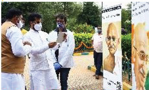
Gandhis life through Augmented Reality